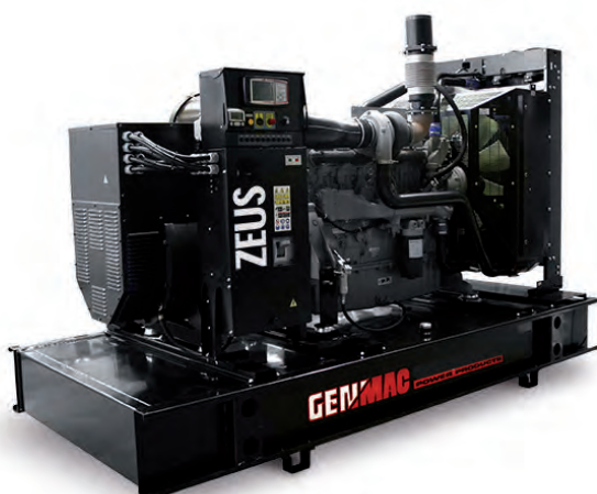
Изображение только для иллюстрации