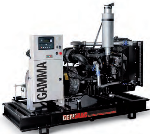
Изображение только для иллюстрации