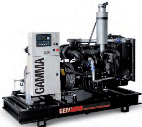
Изображение только для иллюстрации